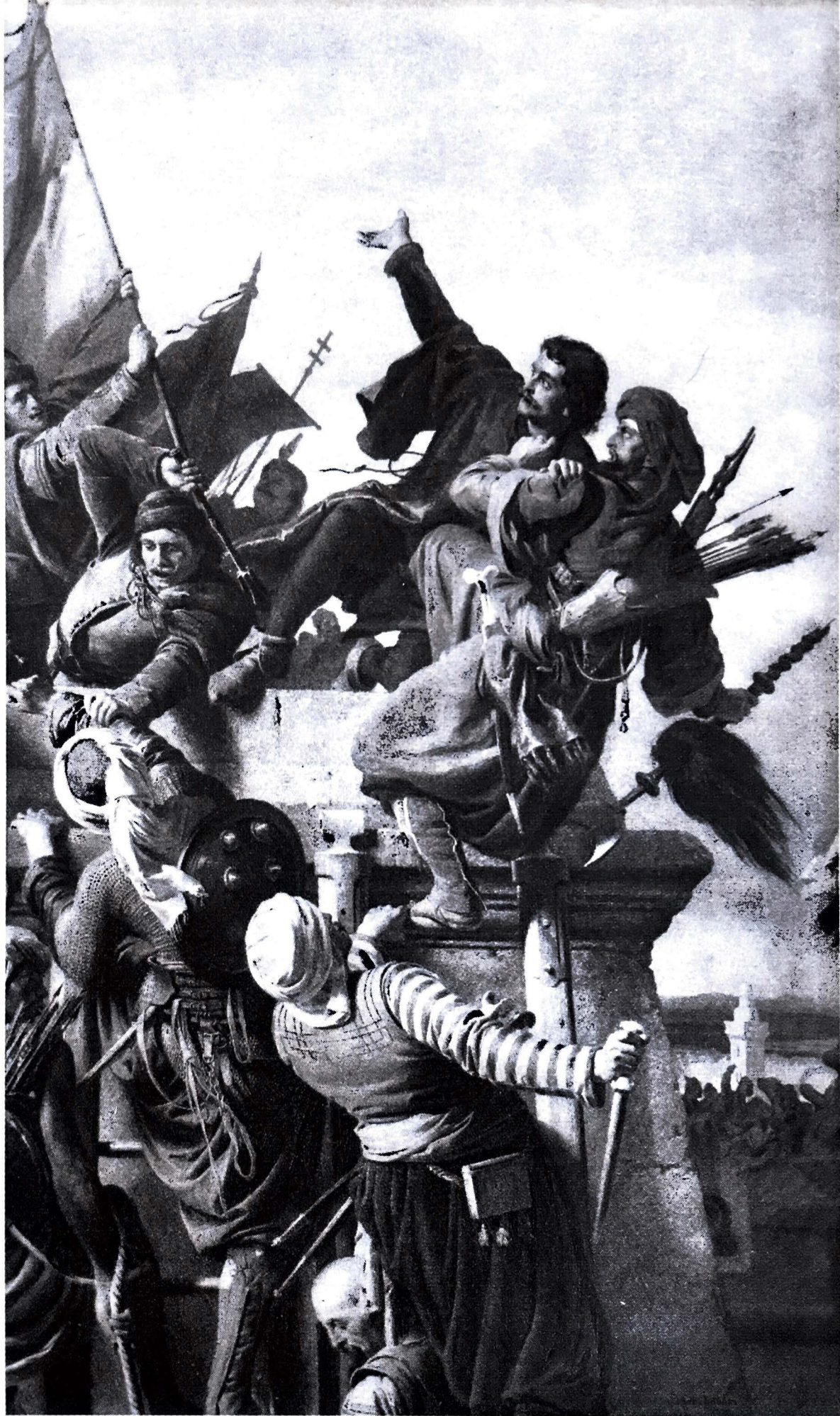
Wagner Sándor: Dugovics Titusz – részlet